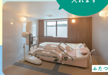
ふたつの機械浴槽