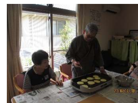
リハビリクッキング