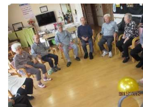
レクリエーション活動

お花見、敬老会、クリスマス会、誕生会などの行事には、近所の方やボランティア、周辺の老人ホームの利用者様も参加され、地域との交流が行われています。また「でんちゃんまつり」は保育園、ストリートダンススタジオ三味線教室等、たくさんの方がご出演くださり、利用者様はもちろん地元の方々にも親しまれています。